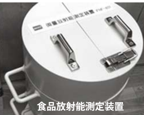
食品放射能測定装置