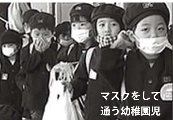
マスクをして 通う幼稚園児